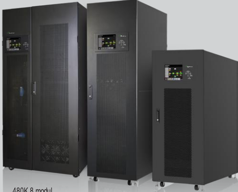
480K 8 modül 600K 10 modül